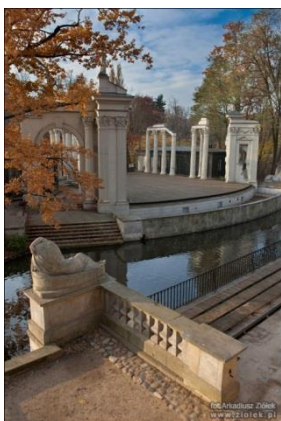
Obiekt nr 5