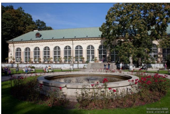
Obiekt nr 6