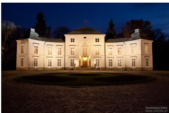
Obiekt nr 4