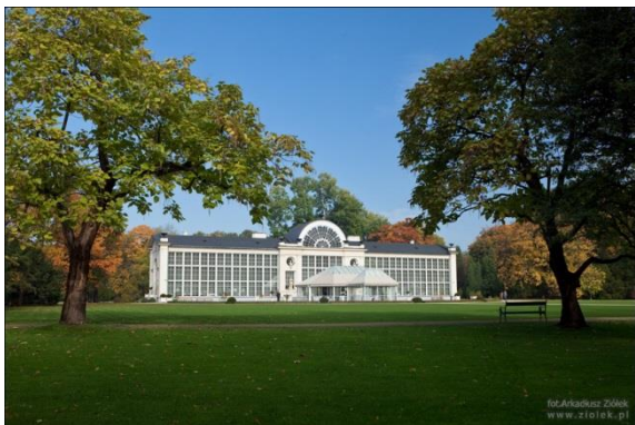
Obiekt nr 3