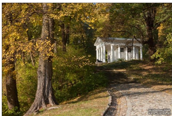
Obiekt nr 7