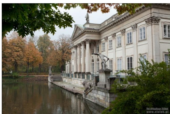
Obiekt nr 2